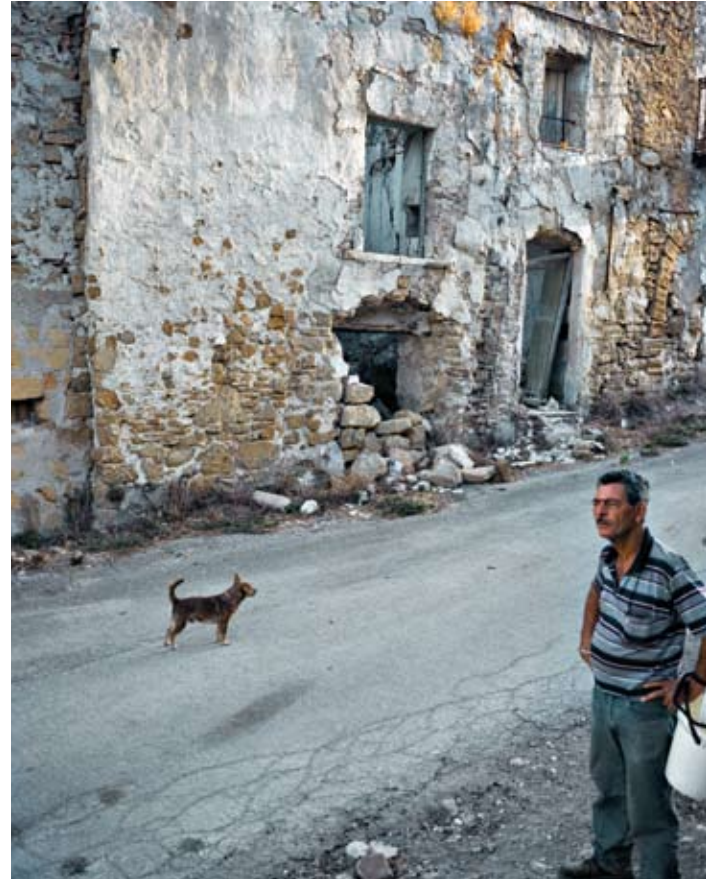
Poggioreale vecchia - ruderi della vecchia piazza Elimo nella pagina precedente Poggioreale vecchia - ruderi della vecchia piazza old Poggioreale vecchia – ruins of the old Elimo square in the previous page old Poggioreale – ruins of the old square